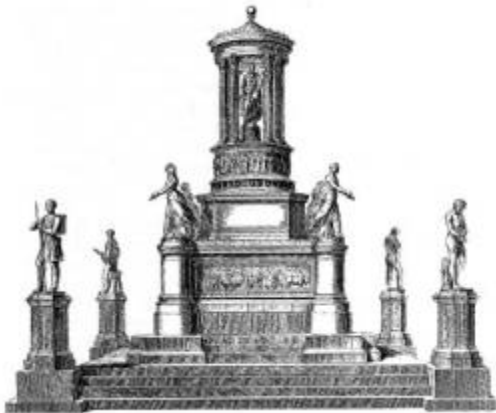
Рис. 2. Альтернативный проект памятника Эмансипации афроамериканцев в ходе Гражданской войны (эскиз).

ства в ходе Гражданской войны, который был предложен в тот период. Конкурирующий проект изображал вооруженных чернокожих солдат, стоящих вокруг усыпальницы с гробом А. Линкольна (рис. 2). Таким образом, если Мемориал Вольноотпущеннику объяснял освобождение афроамериканцев от пут рабства исключительно актом «доброй воли» белых, олицетворяемой фигурой А. Линкольна, то альтернативный проект, так и не реализованный, связывал это с вооруженной борьбой самих бывших рабов против своих поработителей.